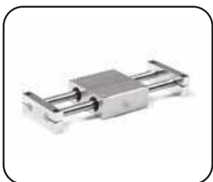
TABLE LINÉAIRE SUR DOUILLE À BILLES