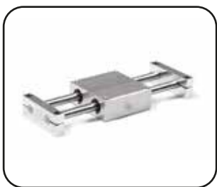
TABLE LINÉAIRE SUR DOUILLE À BILLES